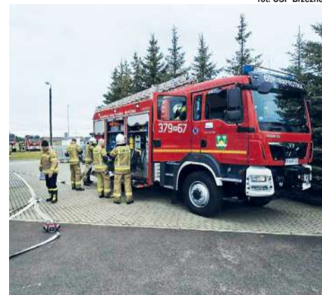
fol. OSP Brzeźno

czyli procedurę wejścia do pomieszczenia objętego pożarem, poruszanie się z linią gaśniczą oraz techniki operowania prądami gaśniczymi. Na koniec zadaniem rot