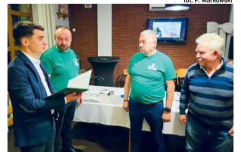
fol. P. Markowski

Zebranie było również dobrą okazją do przedstawienia inicjatyw i propozycji. Po zakończeniu części oficjalnej, wszyscy uczestni-