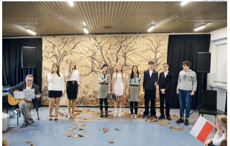
fol. P. Markowski

Prowadzący, dziękując za udział w spotkaniu, wyrazili nadzieję, że będzie ono inspiracją do codziennego patriotyzmu pełnego szacunku, troski i nadziei. | mar.