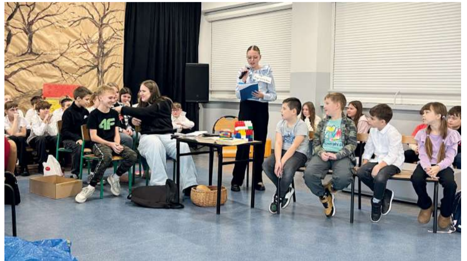
fol. P. Markowski

szkolna i główna autorka scenariusza mówi, że w pierwszej części tego dialogu jest zawarte najważniejsze przesłanie spektaklu.