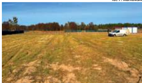
fol. P. Markowski

Rozpoczęły się prace związane z budową żłobka w Brzeźnie. Umowa z wykonawcą na realizację tej inwestycji została podpisana trzeciego lutego, ale dopiero teraz pogoda pozwala na podjęcie robót.