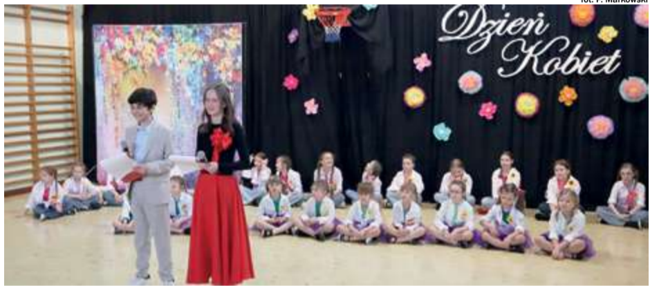
fol. P. Markowski

— Drogie panie. W dniu waszego święta życzę wam, abyście każdego dnia pamiętały o tym, że jesteście najważniejsze w życiu, że każda z was jest piękna, silna, odważna i mądra, i że każda z was dostrzega rzeczy, których mężczyzna nie jest w stanie zauważyć. To nadzwyczajny dylemat, przed którym staje poeta: co jest piękniejsze z dwóch zjawisk - życie, czy może kobieta? Dylemat dla Salomona, wart jednak prawdy odkrycia. Chce się powiedzieć - kobieta, lecz czymże kobieta bez życia? To fakt, więc jednak życie, ale znów spójrzmy, niestety, życie