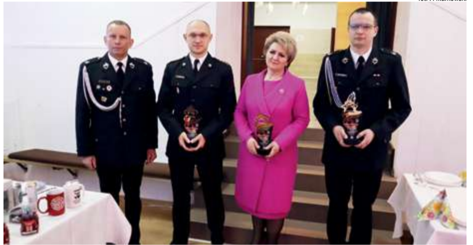
fol. P. Markowski