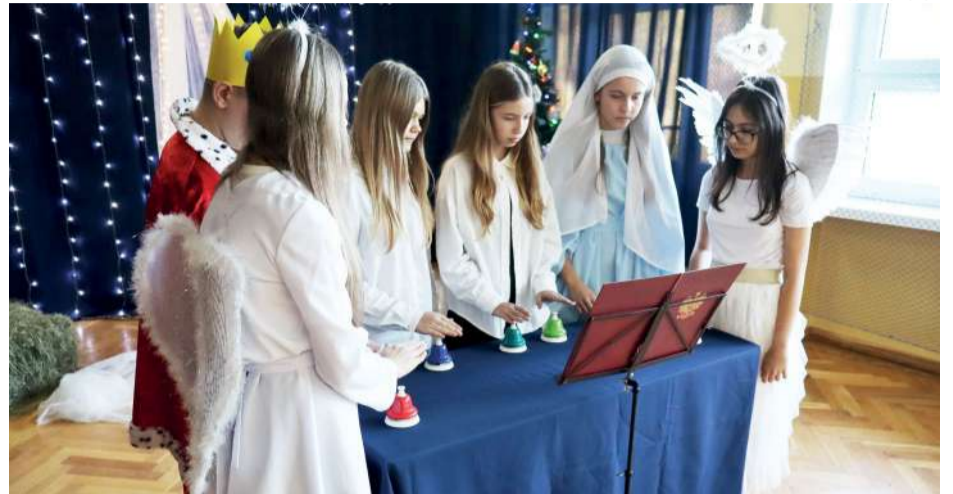
fol. P. Markowski