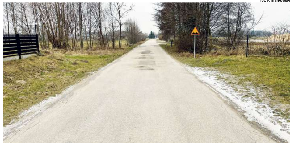
fol. P. Markowski

— Takie są szacowane przez kosztorysantów ceny tych dróg, które ewentualnie chcielibyśmy zrobić. Wymienione, zridowskie, już bez FOGR-ów i tych mniejszych. Do tego dochodzą wykupy. Mamy już wykupy prawie w całości chyba na drodze Szczepidło. (...) Tak że, planując nasze budżety w tej kadencji musielibyśmy zdecydować, które drogi chcemy zrobić i pewnie nie wszystkie z nich wpisują się w dofinansowania. (...) Jesteśmy dokumentacyjnie przygotowani. Mamy decyzję pozwalającą na budowę również. Nie ma tu ujętej ulicy Sosnowej (w Brzeźnie - przyp. red.), którą odwiekamy tyle lat, na pewno bardzo potrzebnej, bez chodnika, tak bardzo uczęszczanej, bo są dwa duże zakłady (...), gdzie ten ruch ciężarowy jest bardzo duży. Jest gęsta strefa zamieszkania i sama to przeszłam wieczorem. Nie ma tam pobocza, a mnóstwo dzieci wysiada, więc stwarza to (zagrożenie - przyp. red.) bezpieczeństwa i tak gdzieś jako priorytet ustaliłam w głowie, że trzeba zadbać o to. Myśmy już próbowali, ale najpierw musielibyśmy dokonać podziału z powiatem, że wydzielona została część powiatowa i część gminna. Zasiedzieliśmy tę drogę, więc procedura trwa bardzo dłu-