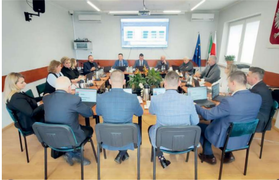
fol. A. Młodzinak

Radni gminy Krzymów podjęli trzy uchwały dotyczące udzielenia pomocy finansowej Powiatowi Konińskiemu. Chodzi o wsparcie programu utylizacji azbestu, zakupu mikrobusa do przewozu osób niepełnosprawnych dla Warsztatu Terapii Zajęciowej w Paprotni oraz na realizację zadań w zakresie przeciwdziałania przemocy w rodzinie. Dwudziesta czwarta sesja Rady Gminy Krzymów odbyła się dwudziestego ósmego stycznia.