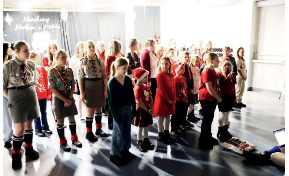
fol. P. Markowski