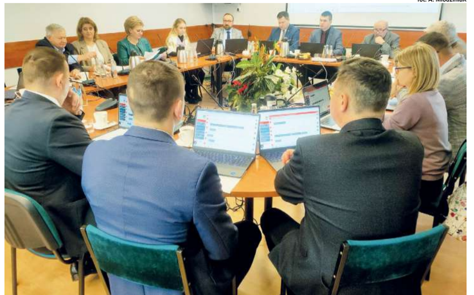
fol. A. Młodzinak

To kwota 1 702 000 złotych, przeznaczona głównie na dwa zadania: budowę kom-