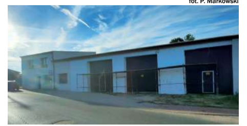
fol. P. Markowski

Ponadto, jak co roku, jednostka otrzymała dotację z Krajowego Systemu Ratowniczo-Gaśniczego. W tym roku było to 9 557 złotych i do tego z Urzędu Gminy